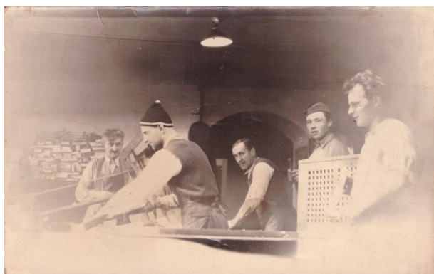
Praktykanci z instruktorami zawodu w warsztatach przy Strugu