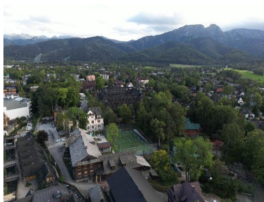
Obecny wygląd głównego budynku szkoły z nowym boiskiem z lotu ptaka, 2025 r.