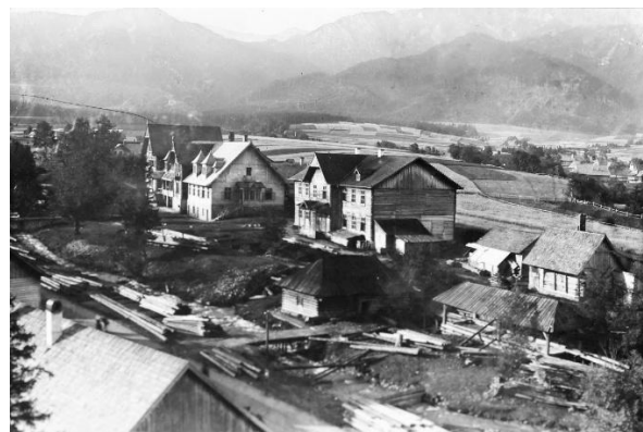
Siedziba szkoły widziana z dalszej perspektywy. Stojące obok Muzeum Tatrzańskie i Dworzec Tatrzański wraz z drewnianym budynkiem szkoły zasłużyły sobie na miano tzw. Kompleksu Trzech.