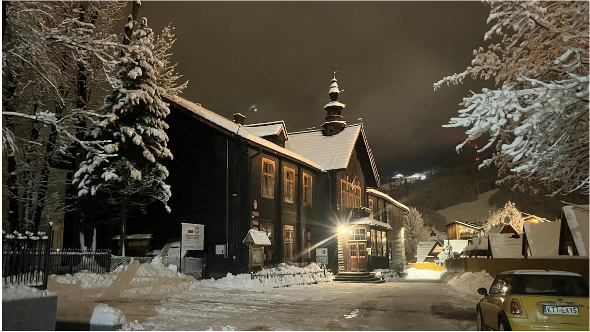
Szkoła w urokliwej zimowej szacie. 2026 r.