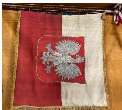
Sztandar szkoły ufundowany w 1977 r. na 100-lecie szkoły.

To okres nadziei i rozczarowań, bo z okazji jubileuszu stulecia istnienia szkoły, który świętowano w 1977 r., wyłoniła się możliwość wzniesienia nowego, bardzo potrzebnego obiektu. W miejscu planowanej lokalizacji na Harendzie wmurowano nawet kamień węgielny, ale już w momencie wprowadzenia stanu wojennego (1981 r.) z marzeniem o komfortowej i nowoczesnej bazie trzeba było się pożegnać. Do budowy nigdy nie doszło. Pomimo trudnej sytuacji gospodarczej i politycznej szkoła wzbogaciła się jednak o trzy wymagające remontu budynki, co na jakiś czas rozwiązało problemy lokalowe.