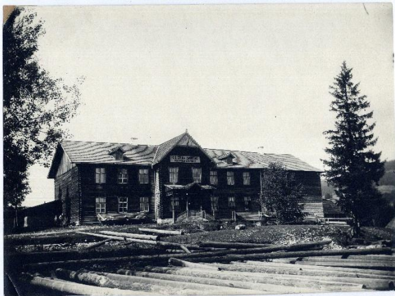
Budynek główny szkoły po pierwszej rozbudowie na przełomie XIX i XX w. (widoczna dobudówka, ale brak jeszcze charakterystycznej wieżyczki).

Od samego początku – jeszcze pod zaborem austriackim – szkoła zaczęła odnosić sukcesy na wystawach galicyjskich i wiedeńskich. Interesowały się nią i odwiedzały znane osobistości, między innymi wybitni malarze: Jan Matejko, Henryk Siemiradzki, Wojciech Gerson czy twórca stylu zakopiańskiego Stanisław Witkiewicz.