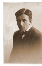
Karol Stryjeński 1923-1927