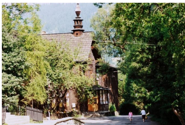
Budynek szkoły otoczony zielonym starodrzewem przed wybudowaniem tzw. Góralskich Sukiennic przy Krupówkach.

Dziś „Budowlanka” to nie tylko miejsce nauki zawodu, ale przestrzeń z duszą, w której tradycja łączy się z nowoczesnością, a uczniowie mają szansę rozwijać się w unikatowym, inspirującym środowisku, jakiego trudno szukać gdziekolwiek indziej.