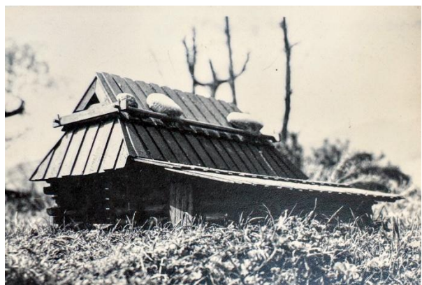
Archiwalne zdjęcia przedstawiające wyjątkowy, ale niestety już nieistniejący skansen przy „Budowlance”